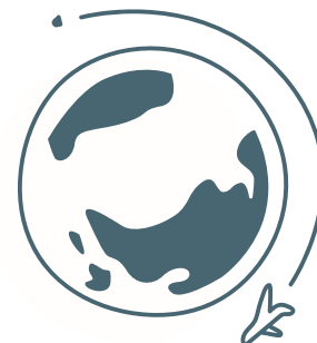
TABELLA DEI VOLI UTILIZZATI